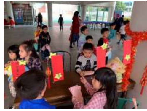
燈謎設計優勝作品