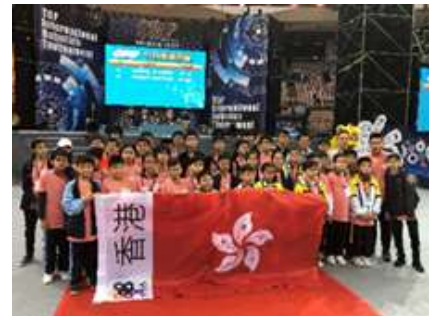
完成比賽後， 部份香港代表隊伍在區旗後合照