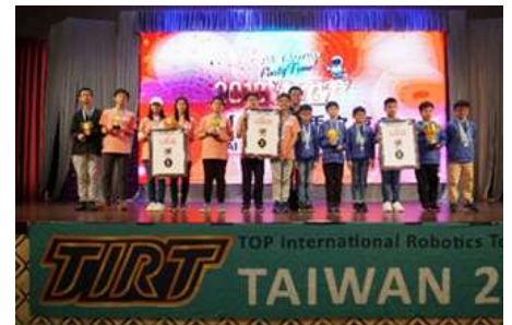
2019 年度奪得兩季冠軍的畢業生 師姐和在校的師弟組成兩隊代表 隊出賽，最終勇奪亞軍及季軍