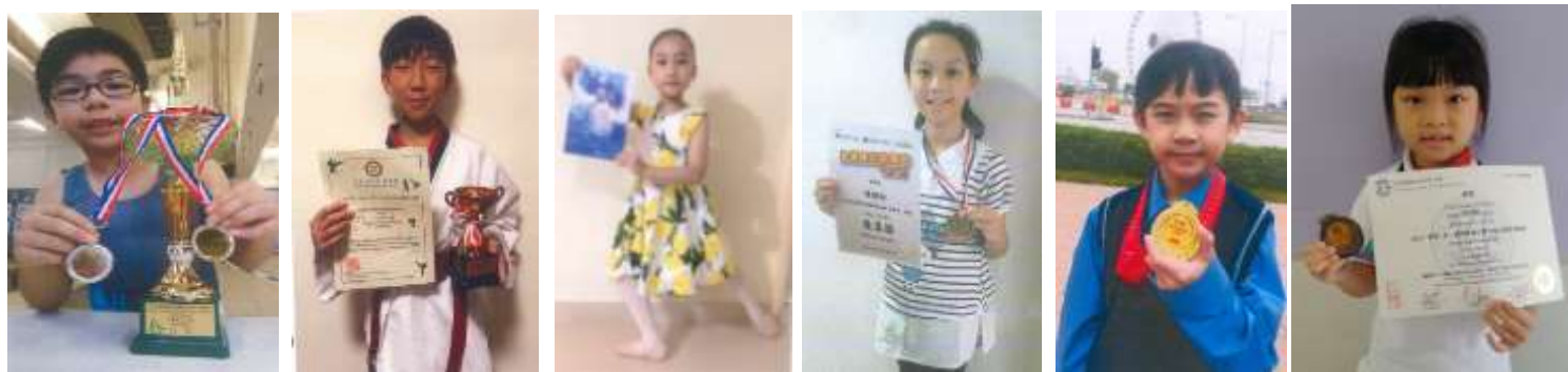
體操 2 金 1 銀

學生因應興趣發展潛能，透過持之以恆的訓練，以達至預期目標。達標的學生可於月會中與全校師生一同分享成果及喜悅。