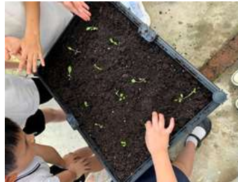
經過三堂種植班及個半月的灌溉，幼苗長大了