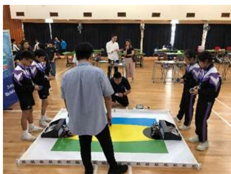
第二季冠軍賽，本校 A、B 隊對壘

於 2019 年度 ROBOT SOCCER 機械足球挑戰賽中，本校 EV3 機械人設計班校隊成員取得兩冠一亞一殿成績，成為 2019 年度全年總冠軍，並奪得 2019 年台灣國際錦標賽兩個香港代表名額。另外在亞太機械人聯盟競賽香港區選拔賽中，奪得銀河守護任務的優異獎。