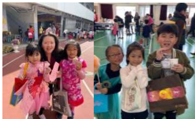
整個校園沉浸在節日的氣氛裡，喜氣洋洋