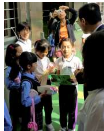
同學們看見和藹親切的局長，都感到十分高興。