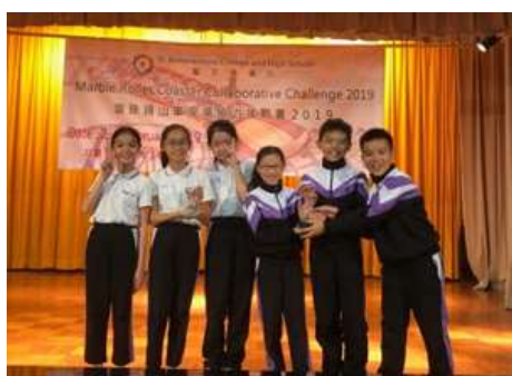
滾珠過山車現場協力挑戰賽中，五、六年級兩隊同獲銅獎