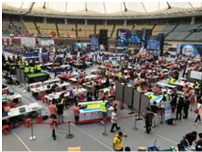
場地內有多項比賽同時進行， 同學有空時會去觀摩其他比賽