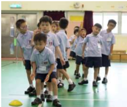
同學們踴躍參與活動區遊戲

每年開學前8月，本校會為小一新生舉行小一適應日，目的是為幫助他們能儘快適應新的學習環境。此外，本年度本校亦為幼稚園學生舉辦幼小體驗課，讓他們一嘗小學生活的滋味。