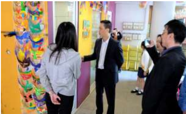
教育局局長楊潤雄到各樓層參觀

本校學校管理委員會成員、家長、教師及學生代表更與局長進行面談，會面氣氛和諧愉快。楊局長的到訪，實在是本校的光榮！