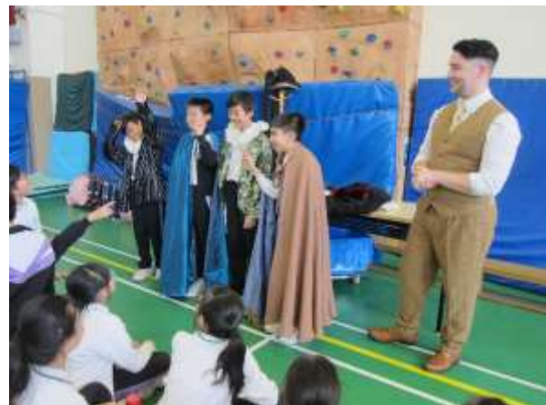
學生體驗穿著劇作戲服