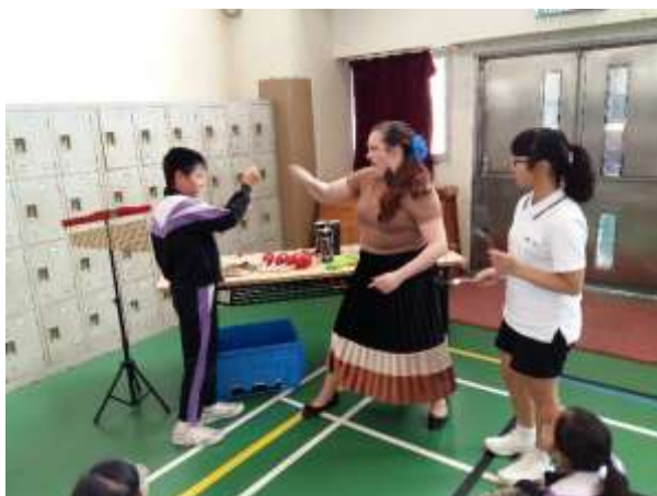
外籍導師跟學生用工具配音，模擬武士決鬥