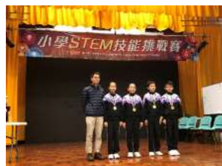
六年級隊獲得金獎