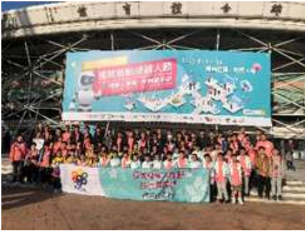
在台灣桃園小巨蛋外 大合照