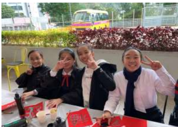
校友教導同學寫揮春

為了加深學生認識農曆新年的傳統習俗，本校於2020年1月21日舉辦了農曆新年主題活動日，內容包括猜燈謎、寫揮春、賀年攤位及家教會製作賀年食品。當天，同學們愉快地參與活動，校園裡洋溢著新年的喜慶氣氛。