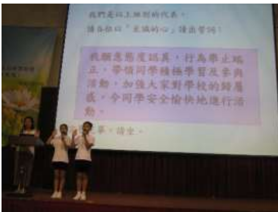
宣誓代表帶領宣讀誓詞

在 2019 年 10 月 11 日月會中為全校學生舉行「一人一職服務學習」宣誓禮，鼓勵同學服務他人，培養責任感。