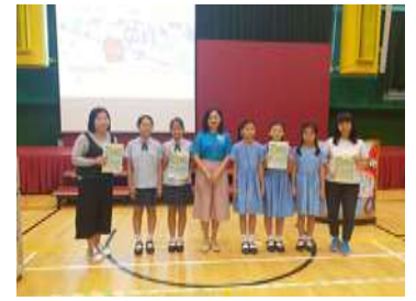
同學出席無塑海洋計劃全港啟動禮