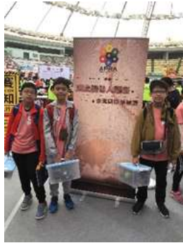
進入比賽場地後，同學只可以靠自己做準備及調整， 教練及老師都不可以幫助的