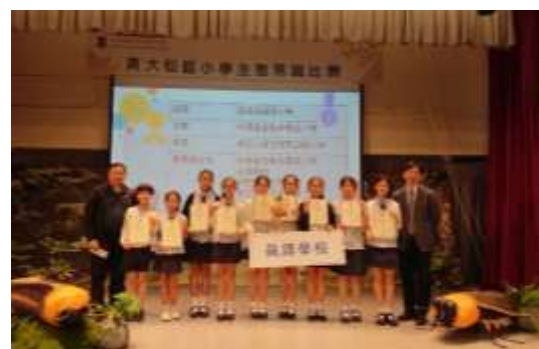
黃大仙區小學生態常識比賽優異獎