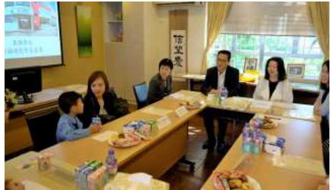
家長、教師及學生與楊局長進行面談