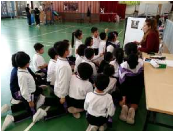
外籍導師向學生介紹大文豪 莎士比亞

本校與「香港賽馬會」及「香港小莎翁 Shakespeare 4All」合辦英語學習活動—「1930's Radio Play –A Midsummer Night's Dream」。活動於 2020 年 1 月 14 日在體育館舉行，參與學生包括四年級及六年級同學，目的為促進學生之英語學習興趣和信心，以及擴闊學生對英語學習的經驗。當中學生能從廣播戲劇之互動遊戲，以及與故事角色交流中，體驗莎士比亞文學的樂趣。