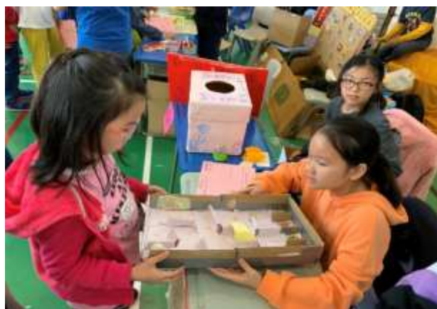
同學主持創意學科常識科攤位遊戲