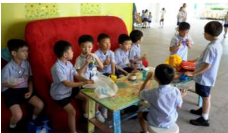
小息時同學們一起聊天真開心