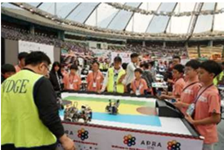
同學要面對三十多隊來自不同 國家或地區的參賽隊伍