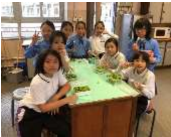
家長及工友姨姨協助下，各組員可以分享羅馬生菜沙拉