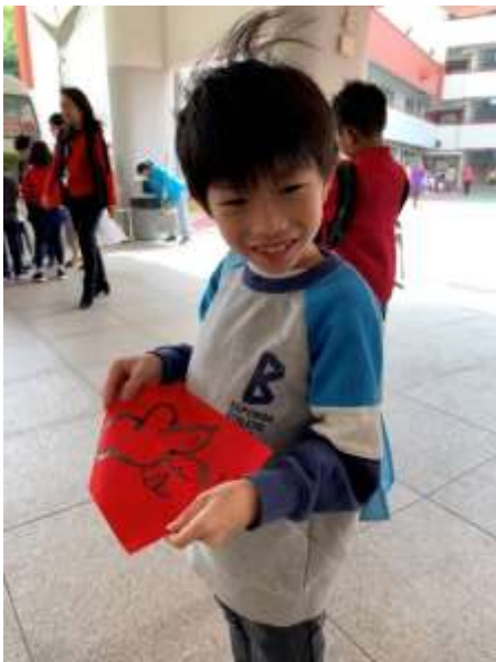
同學自己畫的「小老鼠」 很可愛吧！