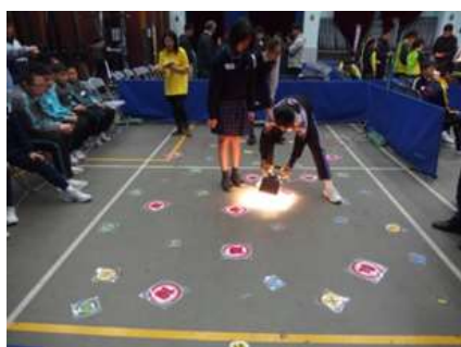
同學自創太陽能模型車參加多項競賽

2019 年本校參加了「STEM 小學技能挑戰賽」、太陽能模型車 mini 奧運會、滾珠過山車現場協力挑戰賽 2019、TURBO JET 氣墊船設計比賽及黃大仙區小學生態常識比賽，且獲得理想成績。