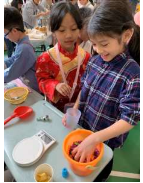
同學們正在購買年貨，找換正確的貨幣；同學們又透過估算，估計糖果的重量。