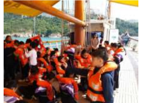
學習海上安全措施