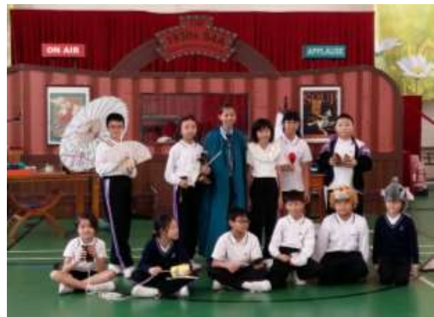
學生完成戲劇互動工作坊後合照