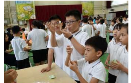
分3個時段進行低、中、高年級活動，各有6個攤位