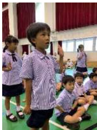
每位同學擁有服務他人的精神