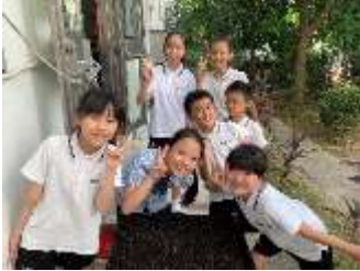
每組負責一個培養盆 種植羅馬生菜