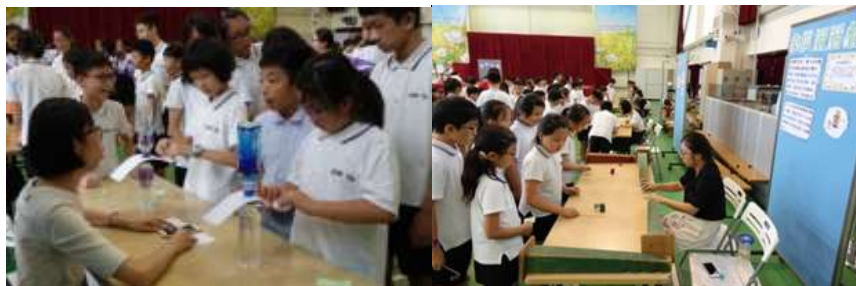
同學完成攤位的實驗後，可蓋印1個，最後可換領小禮物