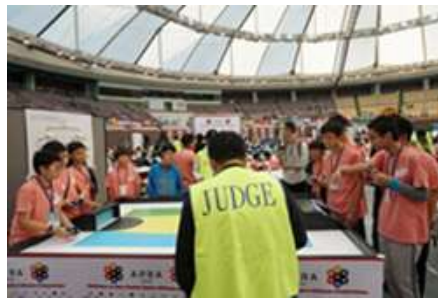
因這比賽是中小學不分組， 所以同學要面對的對手 有其他地區的中學生