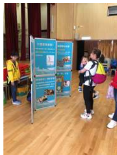
1月4日家長日當天，舉行無塑海洋展覽及攤位遊戲，家長、同學及老師都到來參加