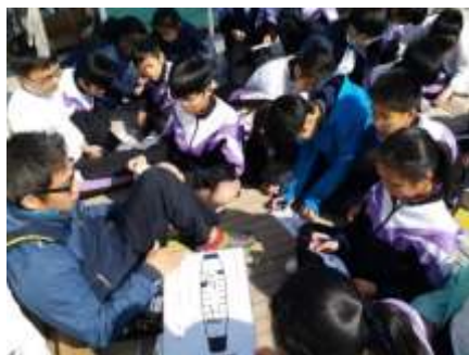
學習基本航海知識