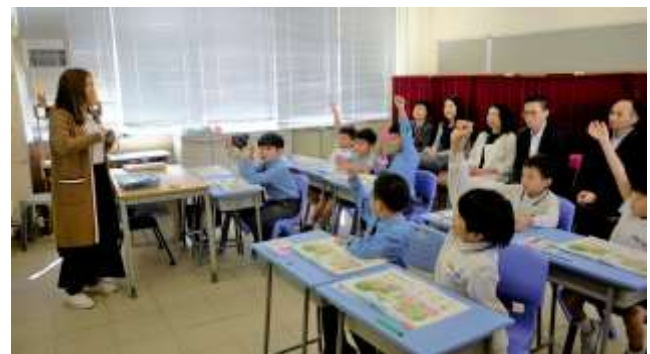
當天楊局長與一眾嘉賓了解學生上課的情況