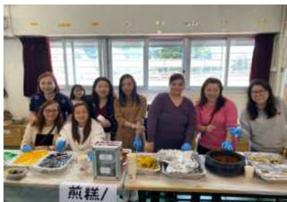
家長們製作各式各樣的賀年食品