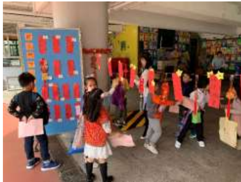
大家努力把燈謎猜出來